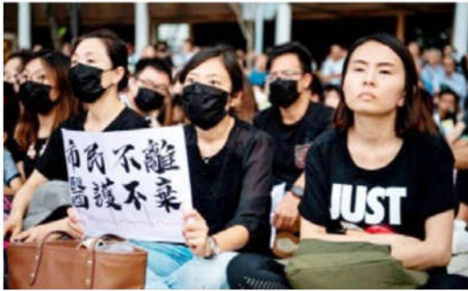
香港医疗界人士8月2日集会表达心声： 市民不离，医护不弃；坚守信念，紧守良知。