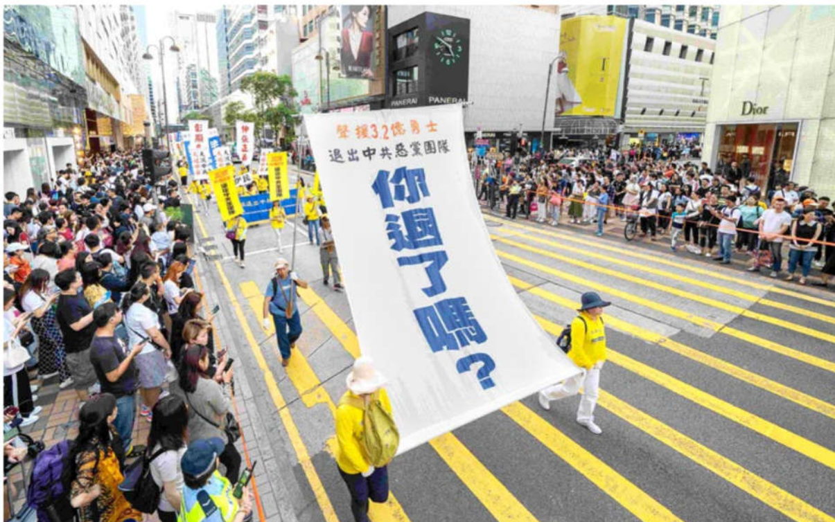
2019年5月12日，香港法轮功学员大游行，传递真相信息。