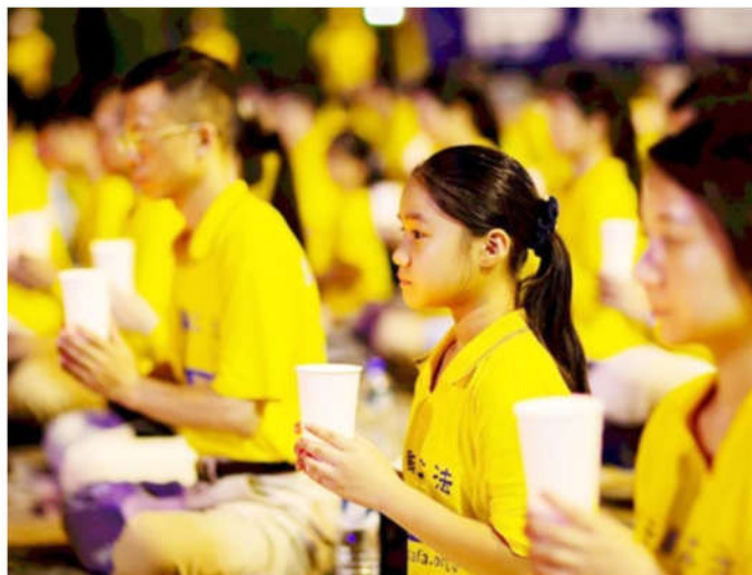
2019年7月20日，台湾法轮功学员纪念反迫害20周年。

最残暴的专制政权，法轮功经受住了这个政权用全部国家机器的灭绝性打压，法轮功是打不倒的。