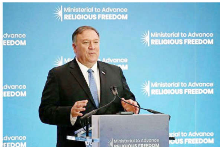
美国国务卿蓬佩奥，2019年7月16日在国务院宗教自由会议上发言。