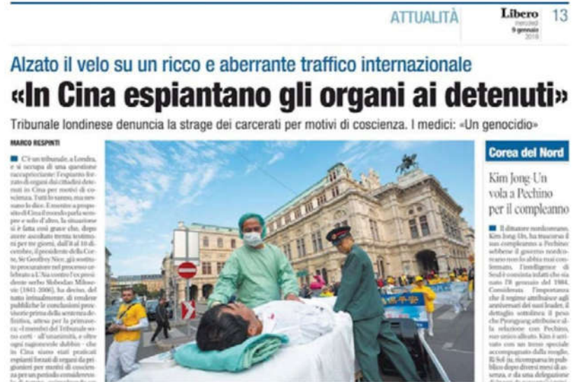
国际媒体多次报道中共活摘器官的罪行。图为 2019 年 1 月 9 日意大利全国发行的《自由日报》（LIBERO）谴责中共虐杀法轮功学员。

据报导，该法庭由英国大法官杰弗里·尼斯爵士（Sir Geoffrey Nice QC）主持，尼斯爵士曾主导国际刑事法庭对前南斯拉夫总统米洛舍维奇的审判。◇