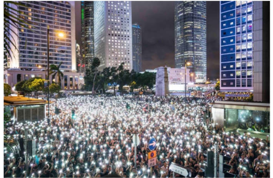
香港公务员8月2日晚集会，参加者举起手机，点点银光照亮香港黑夜。

罗杰斯曾在香港生活五年。他强调自己崇敬法轮功“真善忍”，并逐步认识到中共迫害法轮功的根本原因是中共（假恶斗）与“真善忍”原则的对立。2017年10月他被拒入境香港后，对中共与正义为敌的本质有了更清楚的认知：“中共全面侵犯人权。中共迫害法轮功事关我们每一个人、每一位关心人权的人。”