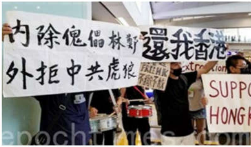
香港航空界职员7月26日集会，横幅： 内除傀儡林郑，外拒中共虎狼。还我香港。