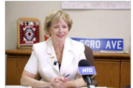
加拿大国会议员朱迪·思格若表示：中共迫害法轮功，是针对守法人群的毫无理由的迫害。

思格若说，加拿大可以利用《马格尼茨基法案》来制裁迫害人权的中共官员，尤其是参与活摘器官牟利者。如果已获得签证的人被证明侵犯了人权，应该被撤销签证。