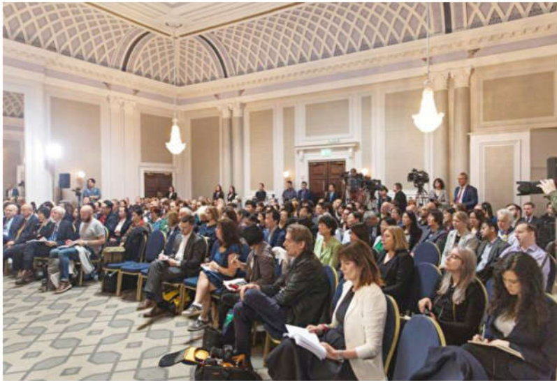
独立人民法庭在伦敦宣判，法庭内聚集了大约 200 名旁听民众和记者。