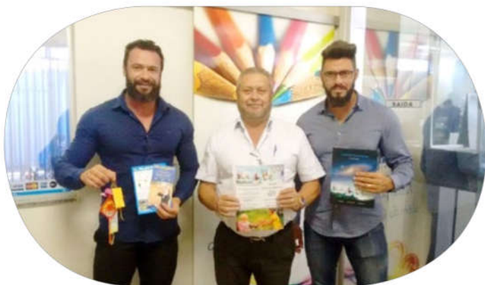
阿陆依先生和两个儿子（摄于2019年春）