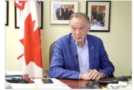
加拿大国会议员彼得·肯特：制裁人权迫害者，加拿大应比美国做得更多。

加拿大国会议员彼得·肯特 (Peter Kent) 2019 年 7 月 在多伦多接受采访时表示，加拿大应该制裁犯下反人类罪的中共官员，他强调，制裁人权迫害者，加拿大应比美国做得更多。他同时赞扬法轮功学员和平理性。