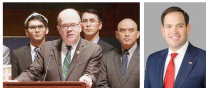
美国国会及行政当局中国委员会 (CECC) 主席麦高文议员 (中)