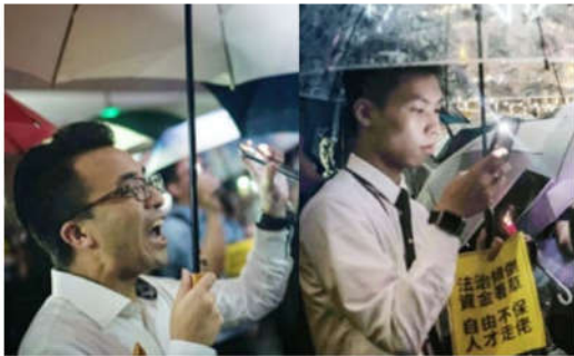
香港金融界人士，8月1日晚集会，人们手持 “法治倾倒，自由不保”标语，高呼“香港人加油”、“没有暴徒只有暴政”口号。