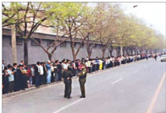
1999年4月25日和平上访现场秩序井然，警察不用维持秩序，在一旁聊天。

江泽民在1999年4月25日当晚给政治局写的信中，明确表露了对法轮功的迅速发展及其凝聚力的妒忌，认为法轮功在和“党”争夺民心，声称要“战胜”