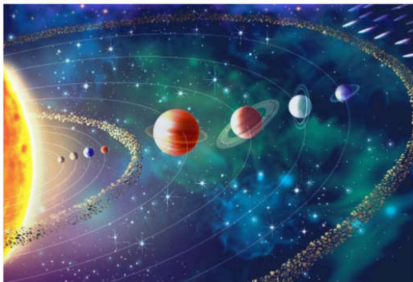
浩瀚宇宙中,人类的智慧微乎其微,任何妄自尊大都是浅薄的。图为太阳系。

Randall) 提出可能存在第五维空间,她说:“甚至可以说它近在咫尺,我们看不到而已。”