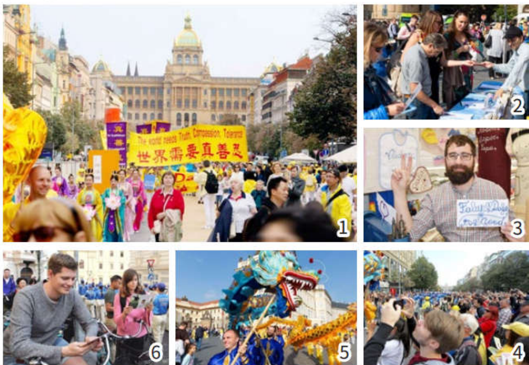
图 1: 法轮功游行队伍在瓦茨拉夫广场 图 3: 桑太拉尼先生绣出“法轮大法好” 图 5: 法轮功学员的舞龙表演