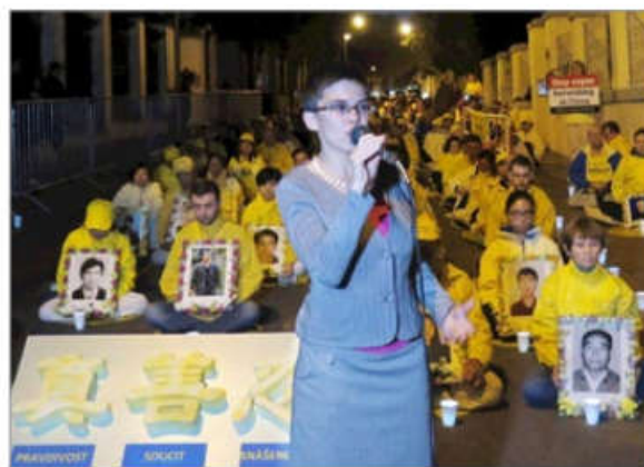
捷克众议院议员瑞琪泰罗娃博士声援法轮功

法轮功游行队伍在布拉格古城穿过时，有很多中国观众在录像，有人用手机把信息与朋友分享，有人说，“哇，（法轮功）队伍这么长。”◇