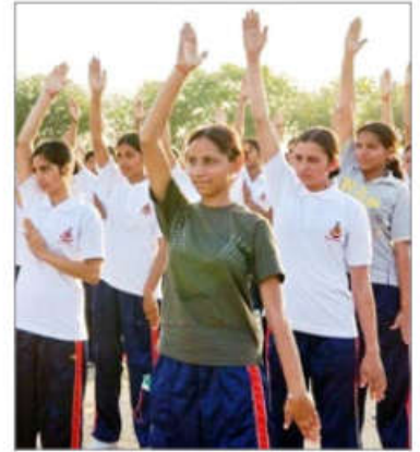
印度德里警察训练大学的女学员在学炼法轮功

印度巴斯卡尔印地文报 (Bhaskar Hindi News) 2018年8月9日刊文《年轻人正在学炼法轮大法以纾解压力》。文章说，法轮大法于2005年传入印度，很多学校都在教法轮功。学生学炼法轮大法后，学习成绩上升，行为明显规范。这个功法不收费。法轮大法强调人要重道德，炼功只是辅助手段。◇