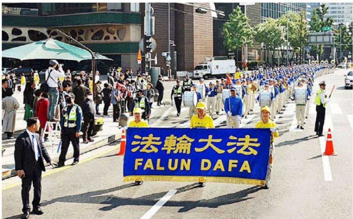
亚洲多国法轮功学员在韩国首尔大游行