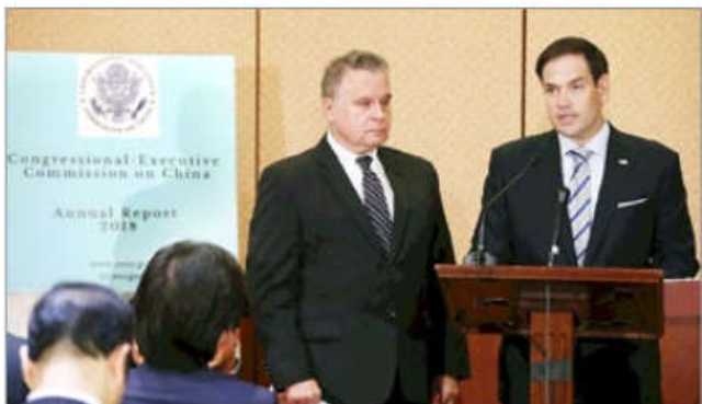
美国联邦参议员、CECC主席卢比奥（右）和史密斯公布国会人权报告。