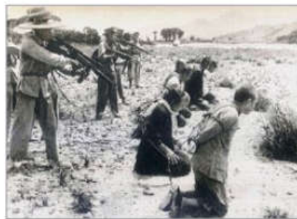
1953年，中共军管人员在新疆阜康地区枪杀地主和“反革命”。

中共残喘20余年后，千疮百孔，独木难支。今天，贵州平塘县掌布河谷风景区的藏字石，天然形成的“中国共产党亡”六个大字，再次昭示着天意。《九评共产党》还原