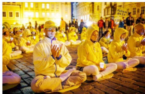
布拉格老城广场上的欧洲法轮功学员与游客